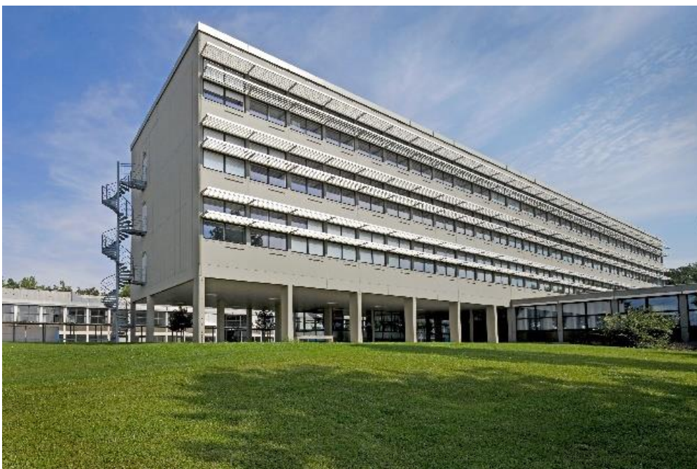
Denkmalgeschützter Standort Prittwitzstraße

gerne kommen wir der Forderung des Runderlasses nach. Hiermit erhalten Sie den aktuellen Stand unserer Bemühungen für ein Klimaschutzkonzept der Technischen Hochschule Ulm. Wie viele andere Hochschulen können wir dieses Jahr kein vollständiges Konzept abliefern, haben uns dafür aber für die Bundesförderung Klimaschutz entschieden um die Weichen für die Zukunft zu legen. Im Folgenden wird in Kürze beschrieben wie die THU in Sachen Klimaschutz aufgestellt ist, welche Herausforderungen wir sehen, was uns dabei wichtig ist und was wir für den Klimaschutz bereits getan haben.