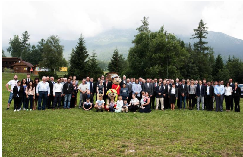
Bild 1: Übergabe des Best Paper Awards auf der ICMEM 2018 in Novy Smokovec, Slowakai. Von links nach rechts [...] (Platzhalterbild)